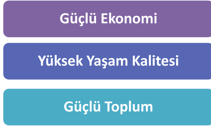
Şekil-3. 2014-2023 İzmir Bölge Planı Gelişme Eksenleri

Çalışmalarına 2012 yılında başlanan ve bölgedeki aktörlerin aktif katılımıyla Ajans koordinatörlüğünde hazırlanan 2014-2023 İzmir Bölge Planı'nın vizyonu "Bilgi, Tasarım ve Yenilik Üreten, Akdeniz'in Çekim Merkezi İzmir" olarak belirlenmiştir. Bölge Planı'nın üç gelişme eksenine ise Şekil-3'de görülmektedir.